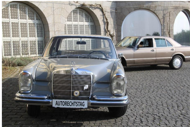
Shuttle-Service zum Petersberg auch mit geschichtsträchtigen Autos