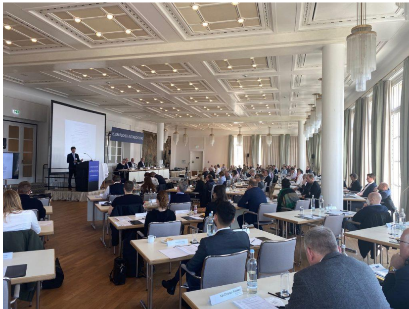
Autorechtstag 2022: Volles Haus, kompetente Referenten, spannende Vorträge